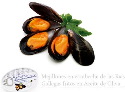
Mejillones en escabeche de las Rías Gallegas fritos en Aceite de Oliva