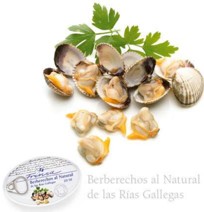
Berberechos al Natural de las Rías Gallegas