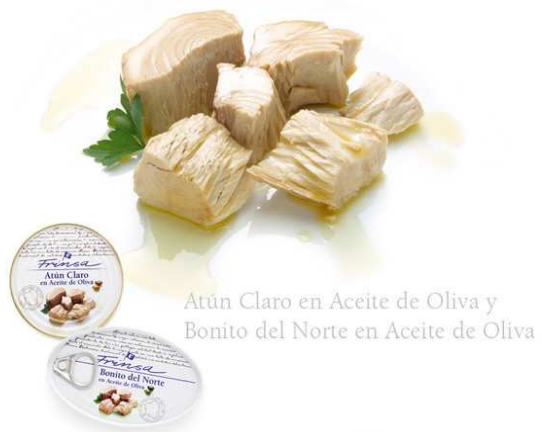
Atún Claro en Aceite de Oliva y Bonito del Norte en Aceite de Oliva