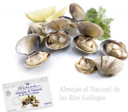
Almejas al Natural de las Rías Gallegas