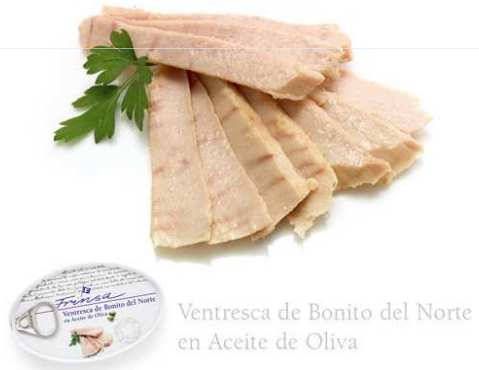
Ventresca de Bonito del Norte en Aceite de Oliva