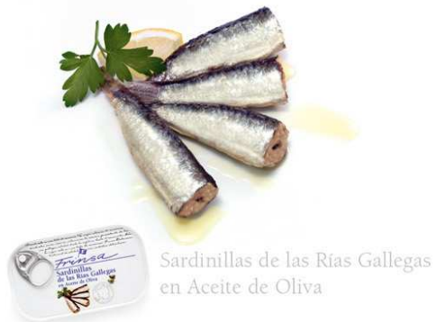
Sardinillas de las Rías Gallegas en Aceite de Oliva