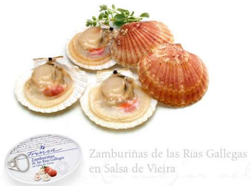
Zamburinas de las Rías Gallegas en Salsa de Vieira