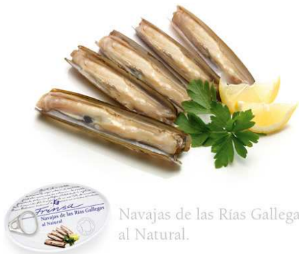
Navajas de las Rías Gallegas al Natural.